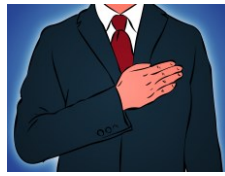
Hand aufs Herz